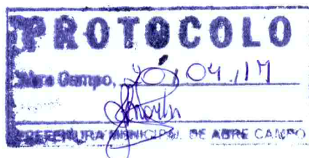
Márcio Moreira Vítor Prefeito Municipal